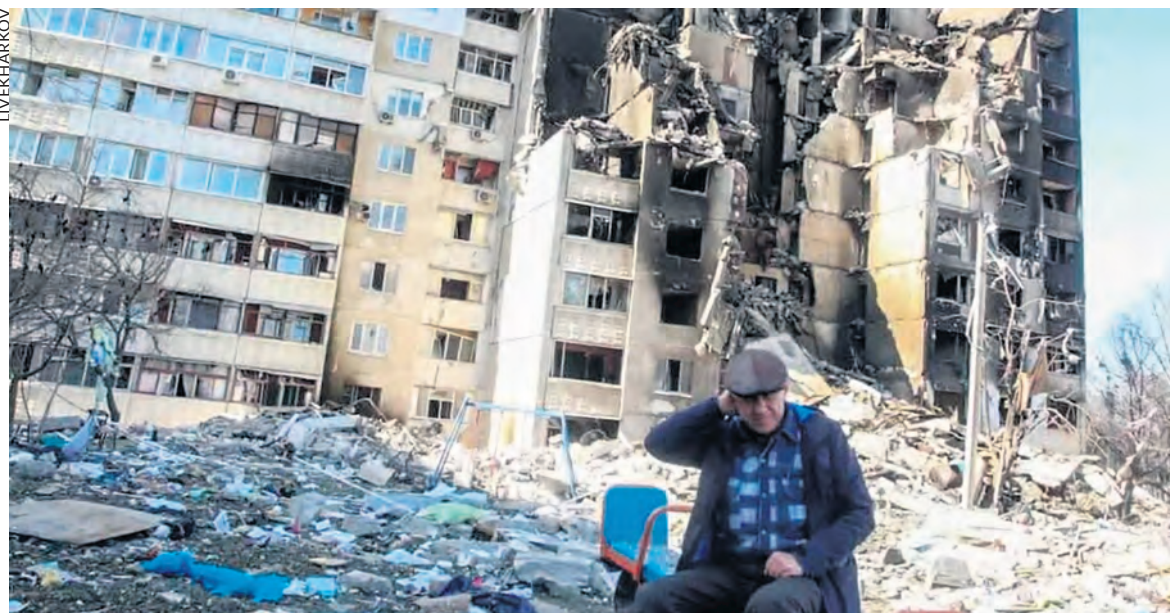
Kharkiv à l'été 2022.

>> ministre ukrainienne affirmait que « les équipes ukrainienne et américaine sont en phase finale des négociations concernant l'accord sur les minéraux », sans en donner la teneur.