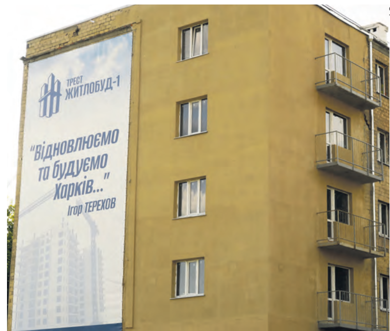
En 2023 : « Rénovons et construisons Kharkiv ». La deuxième ville du pays n'a cessé d'être bombardée.