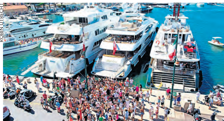
Yachts dans le port de Saint-Tropez.