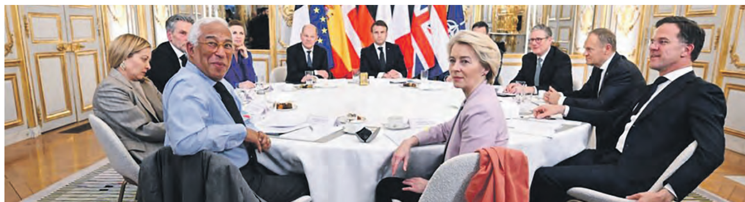
Une réunion du Conseil européen.