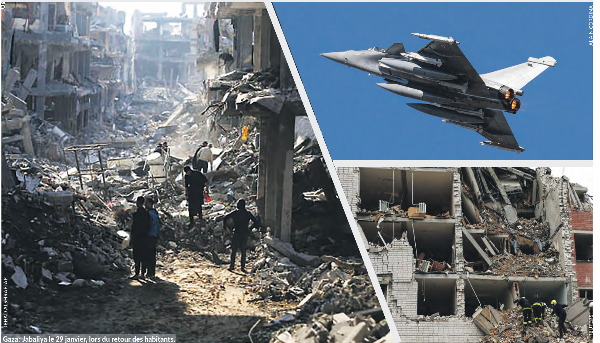
Gaza : Jabaliya le 29 janvier, lors du retour des habitants.