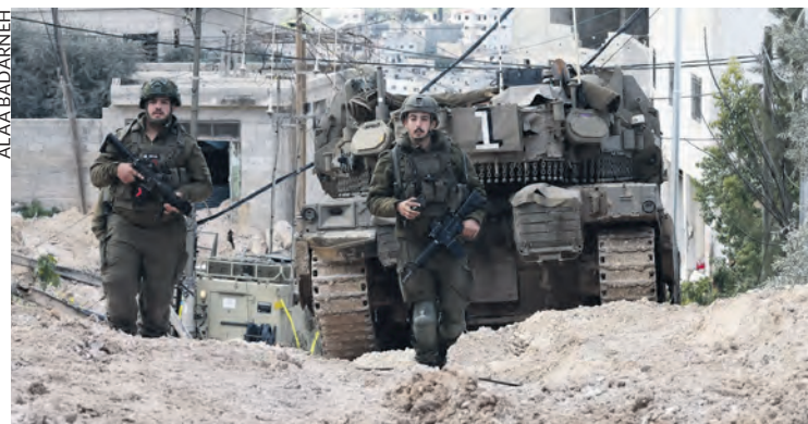
Soldats israéliens dans le camp de Jenine le 24 février.