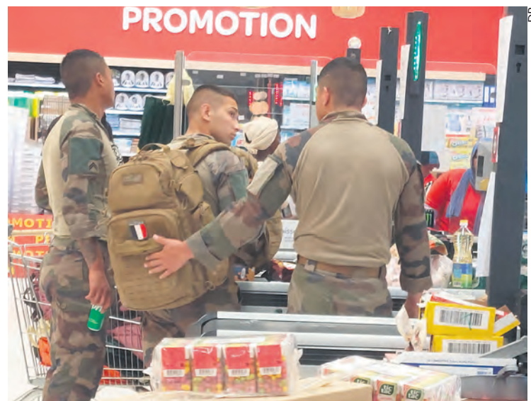
La légion et tic-tac : produits de première nécessité.

Suite au discrédit des élus, l'État a trouvé d'autres