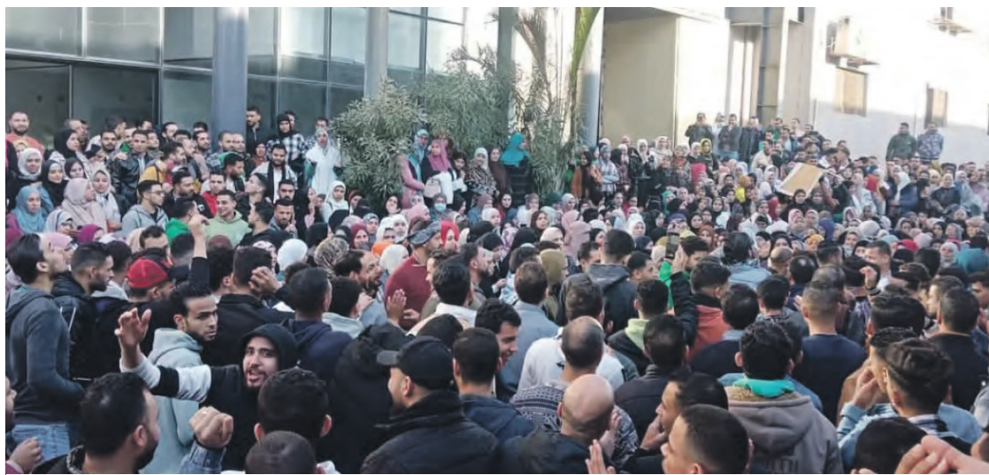
Les travailleurs d'Obour City T&C en grève.

Dans ces deux grèves, les patrons, qui ont fait des concessions, ont aussi fait intervenir les forces de sécurité pour emprisonner les « meneurs ». Mardi