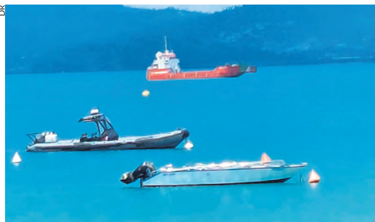
En rouge, une des deux barges seychelloises se reposant dans le lagon de Mayotte... avant de repartir.

Les responsables politiques et administratifs de Mayotte usent de toutes les arguties pour ne pas assumer leur écrasante responsabilité.