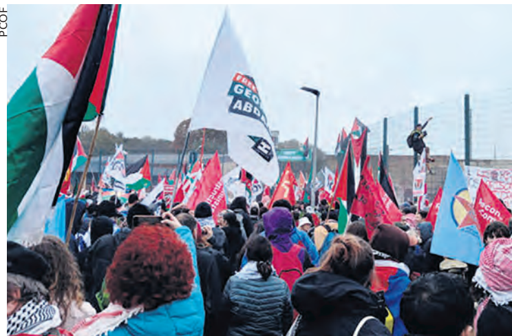
Manifestation devant la prison de Lannemezan en octobre 2024 pour la libération de Georges Ibrahim Abdallah.

Les manifestations prévues mercredi 19 et jeudi 20 février, en faveur de la libération annoncée de Georges Ibrahim Abdallah, ont été interdites par le préfet de police de Paris Laurent Nunez. En même temps, la cour d'appel a repoussé pour la énième fois cette libération.