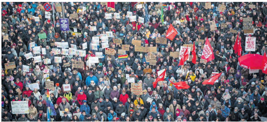
À Munich, le 8 février, 250 000 manifestants clamant : « Munich est multicolore, pas brune ».