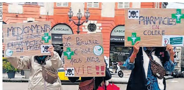
Dans la manifestation des pharmaciens à Limoges en mai 2024.