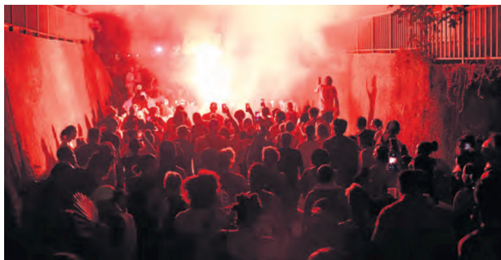
Fort-de-France, le 21 septembre.

Des négociations ont été organisées deux fois par le préfet de Martinique avec, entre autres, les patrons de