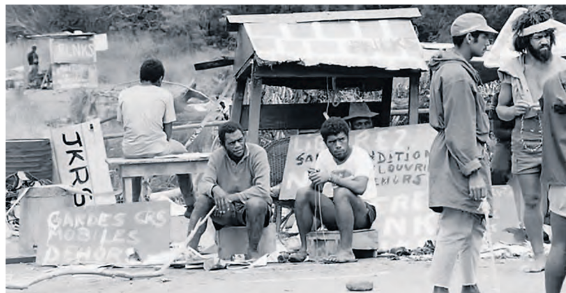
Des militants du FLNKS en 1984.