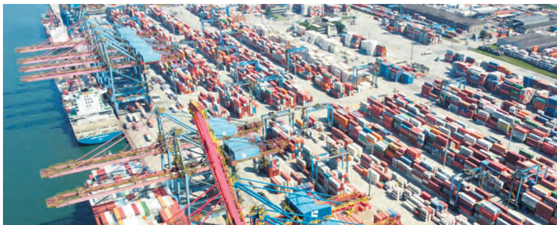
Conteneurs en transit dans le port de Santos.

Ce monopole de fait et les surprofits éhontés qu'il permet n'existent que grâce à la complaisance des États, des plus puissants au premier chef. Les fonds publics ont financé les installations portuaires gigantesques nécessaires aux bateaux géants, des kilomètres de quai, des bassins excavés à 18 mètres, l'élargissement des canaux vitaux de Suez et de Panama, des grues de 65 mètres de portée capables de déplacer des charges de 30 tonnes, des milliers d'hectares pour stocker les conteneurs, des autoroutes et des voies de chemin de fer pour les emporter. Ils ont tous voté les lois exemptant les compagnies d'impôts, d'obligations sociales