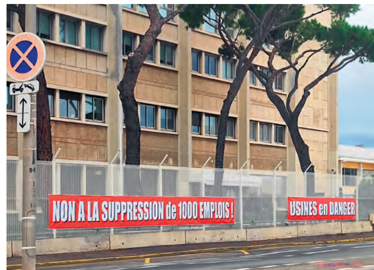
Devant Thales Alenia Space.