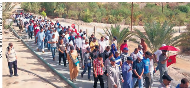
SYNDICAT TOP-FORAGE UMT