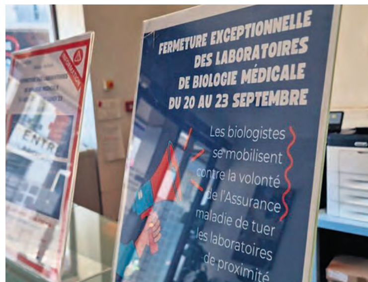
MAM ACTU PARIS

Ce sont pourtant l'État et l'Assurance-Maladie qui ont favorisé la financiarisation du secteur en cherchant à baisser les coûts: en 2000, l'État a autorisé la formation de chaînes de laboratoires; en 2010 il a permis l'organisation de laboratoires multisites, avec un plateau