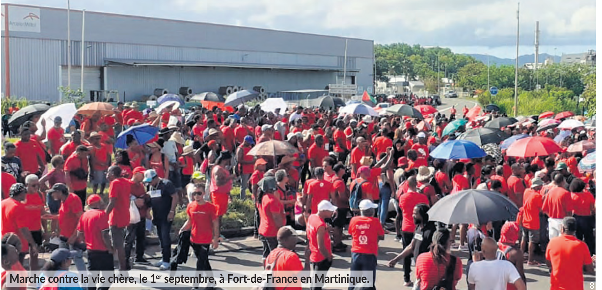
Marche contre la vie chère, le 1 er septembre, à Fort-de-France en Martinique.