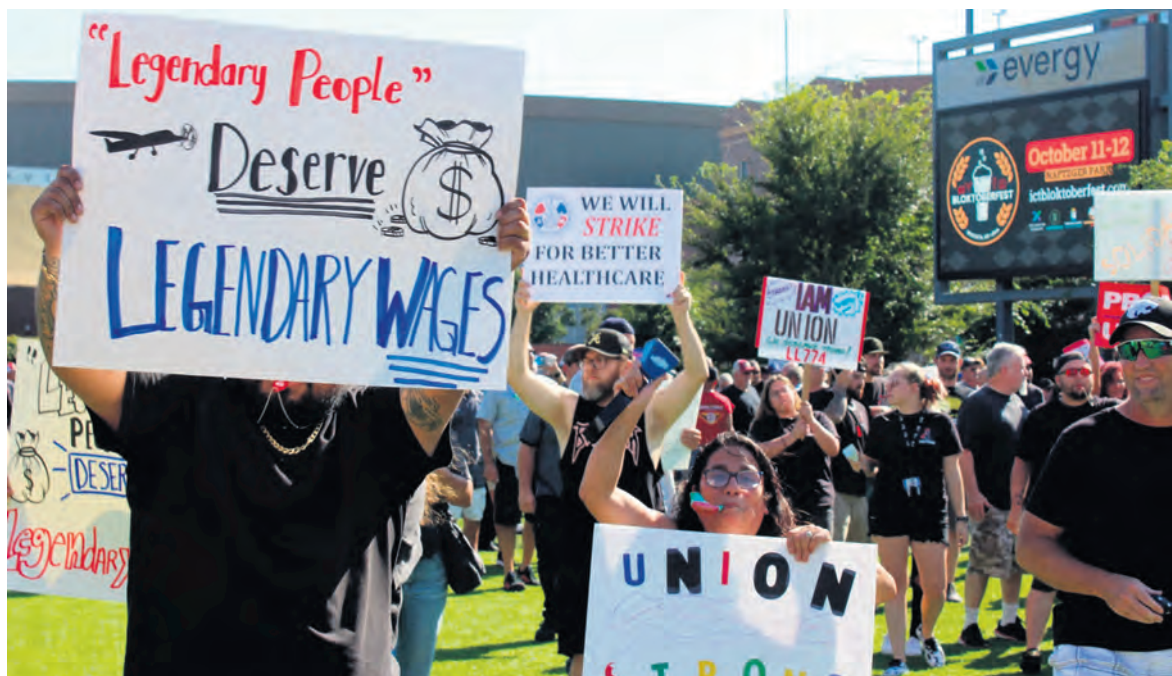
« Des gens légendaires méritent des salaires légendaires », avant la grève chez Textron Texas.

La grève de 33 000 salariés des usines Boeing du nord-ouest des États-Unis dure depuis le 13 septembre. Grâce à leur décision de rejeter l'accord que le syndicat avait négocié avec la direction, ces travailleurs peuvent espérer des augmentations de salaire allant au-delà des 25 % étalés sur les quatre prochaines années qui avaient été signés.