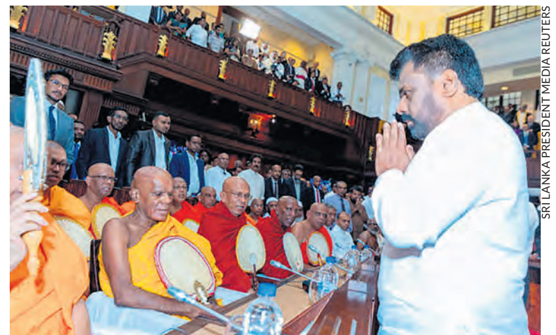
Dissanayaka après sa prestation de serment.

Le prêt du FMI de 2,9 milliards de dollars, conclu l'année précédente, visait à combler partiellement la dette de 36 milliards. Comme chaque fois que la finance internationale propose ce type d'accord, c'est la population qui paye, par une hausse brutale des prix, une aggravation de la vie quotidienne, l'impossibilité de se procurer les produits indispensables, l'effondrement de la santé publique. Dans sa campagne électorale, Dissanayaka a