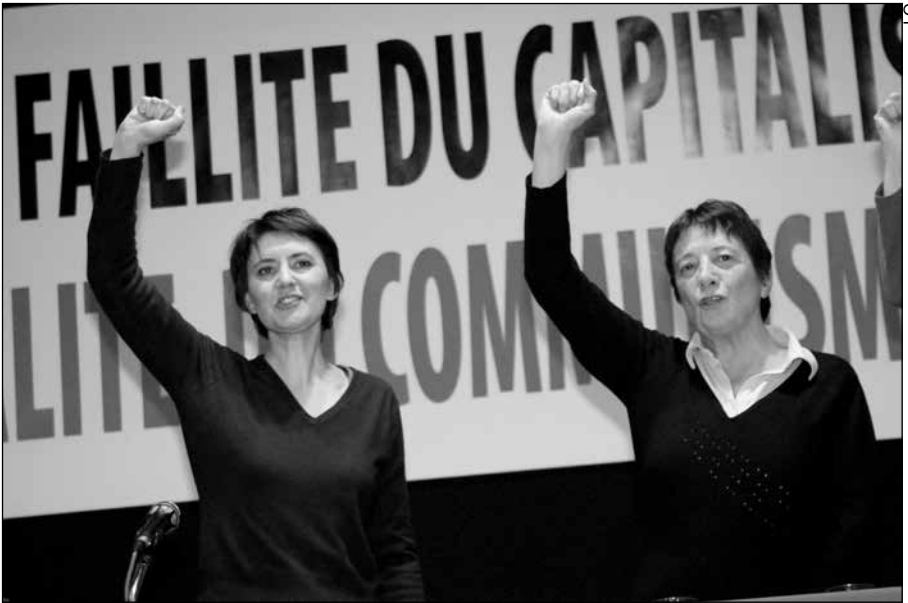
Nathalie Arthaud et Arlette Laguiller.

Nous nous revendiquons des idées communistes, de cette tradition révolutionnaire du mouvement ouvrier qui a pour objectif l'émancipation des classes exploitées par le renversement de la classe capitaliste. Nous ne cherchons pas à prendre des responsabilités dans l'organisation sociale actuelle, basée sur l'exploitation et l'oppression. Nous voulons y mettre fin.