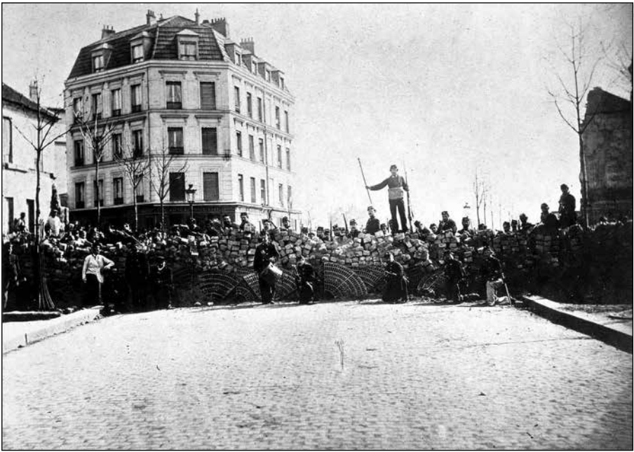
Avec la Commune de Paris en 1871, les travailleurs montèrent « à l'assaut du ciel ».

changer la société, en créer une autre radicalement différente basée sur la propriété collective. Une société sans la domination de l'argent et du profit. Une société et une économie d'abord organisées pour répondre aux besoins de toute la population.