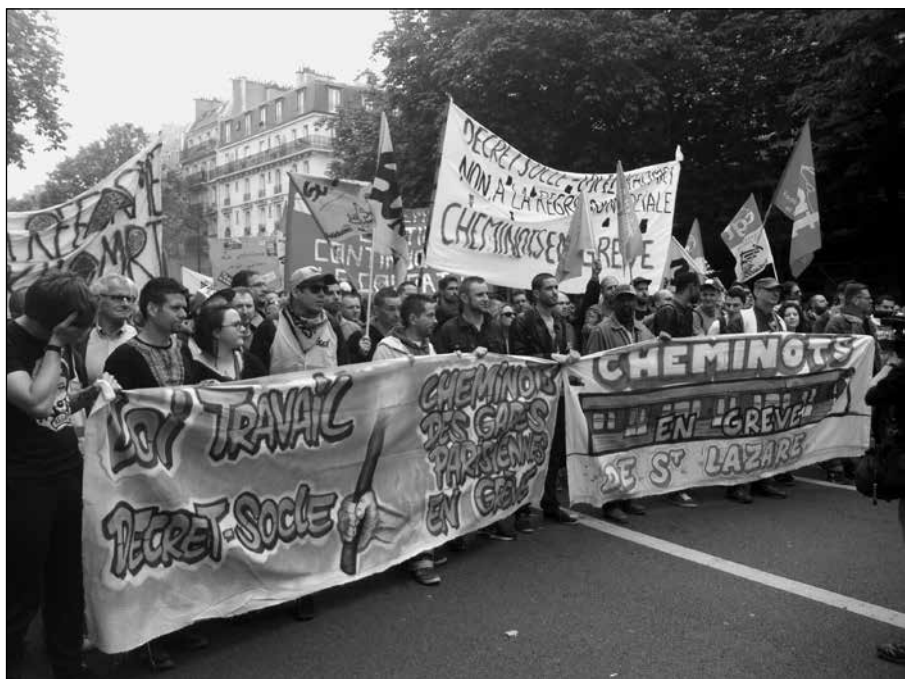
Les cheminots parisiens, à la manifestation contre la loi travail, le 14 juin 2016.

Seule une fraction des travailleurs s'est mobilisée en faisant grève et en manifestant. Mais elle a bénéficié du soutien et de la sympathie de la grande majorité des travailleurs tout au long de ces quatre mois, parce qu'elle a porté les intérêts de tous les travailleurs et qu'elle a exprimé, plus largement, la colère du monde ouvrier. Grâce à cette mobilisation, la classe ouvrière a rompu avec des années de silence.