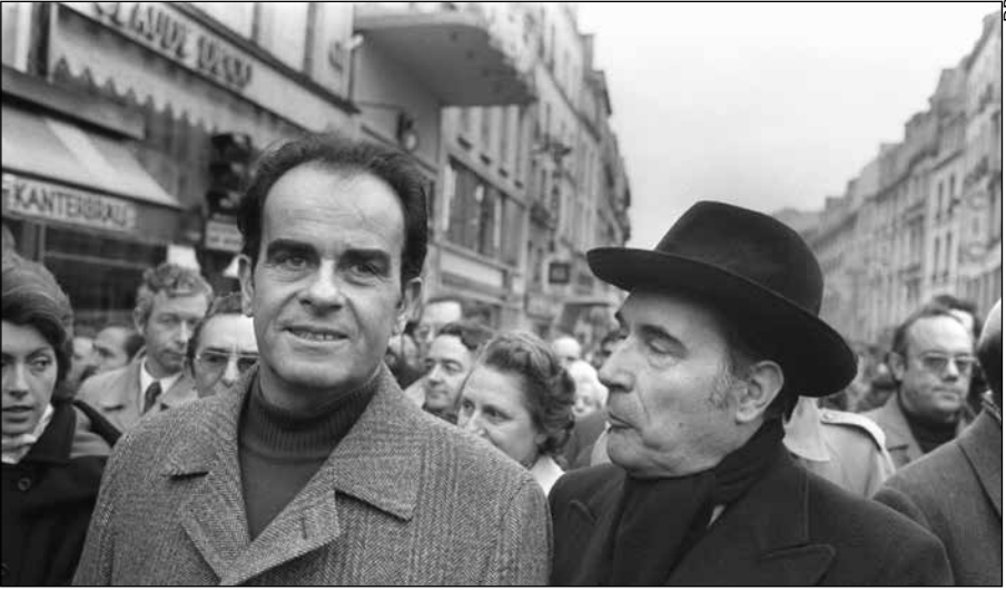
Avec le programme commun, Georges Marchais mit le PCF au service des ambitions de Mitterrand.

Le PC a vidé, au fil du temps, la tradition communiste du mouvement ouvrier de tout contenu révolutionnaire, pour le remplacer par une bouillie réformiste vantant les charmes des élections pour parvenir au pouvoir gouvernemental dans le cadre du système électoral mis en place par de Gaulle, et sans toucher à l'organisation capitaliste de la société, c'est-à-dire au pouvoir de la bourgeoisie.