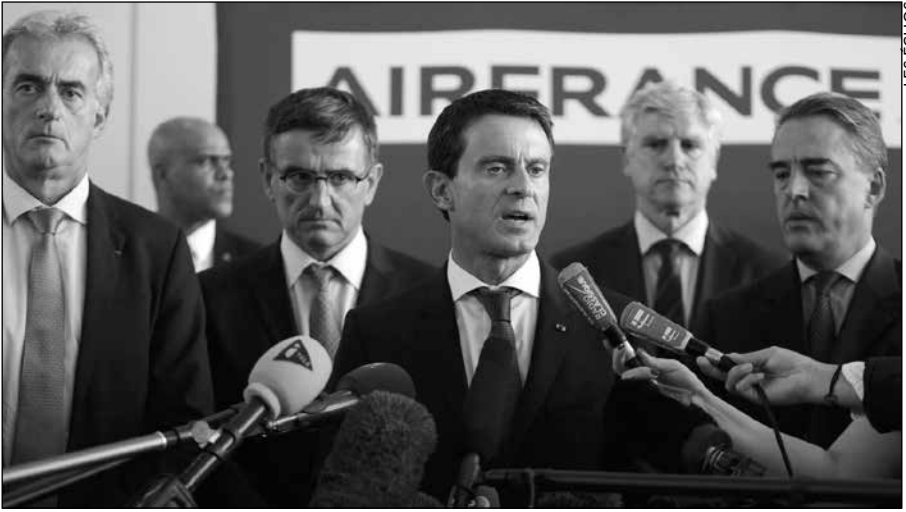
Manuel Valls, au siège d'Air France, en soutien à la direction, qui organise un plan de licenciements (6 octobre 2015).

En politique, la gauche ne désigne plus qu'une écurie de politiciens, sans rapport depuis longtemps avec les partis que le mouvement ouvrier a fait naître. Des politiciens qui parlent des grèves et des syndicats avec autant de hargne de classe que la droite et le patronat.