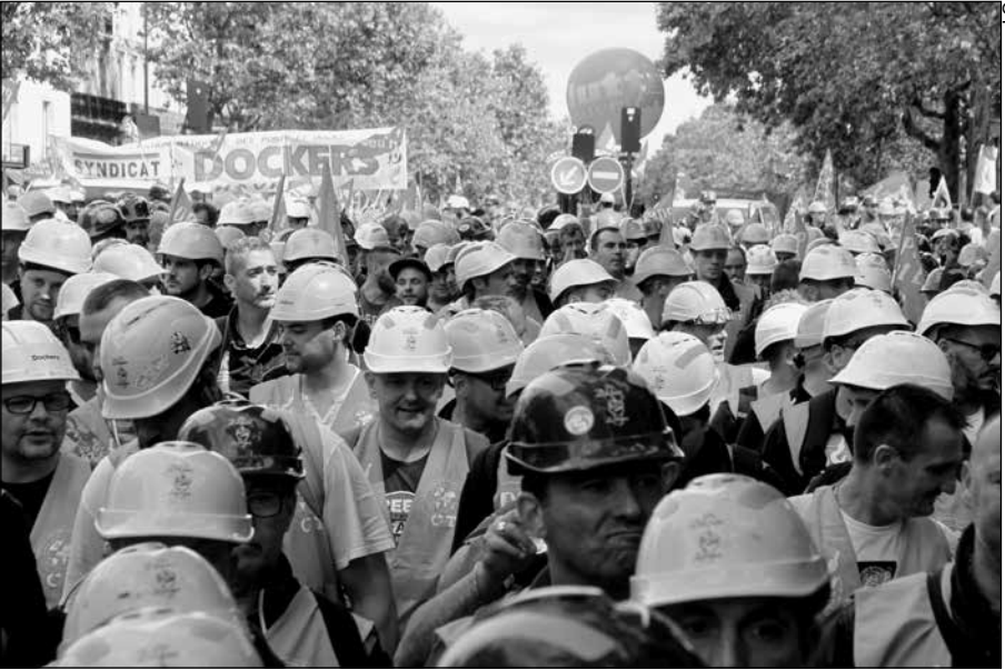
Les dockers du Havre, le 14 juin à Paris, contre la loi travail.

C'est alors que le patronat, les notables et les politiciens à leur service réalisent, enrégés, combien ils sont dépendants des travailleurs. Les CRS peuvent certes déloger quelques centaines de manifestants qui bloquent une raffinerie ou une voie de chemin de fer. Mais ils ne peuvent pas remplacer les salariés de ces raffineries en grève, ni s'improviser conducteurs de trains, aiguilleurs ou pilotes d'avions. Ils ne peuvent pas non plus remplacer les ouvriers sur les chaînes de montage, les employés, les techniciens ou les ingénieurs, qui sont tous des maillons indispensables pour faire tourner les entreprises.