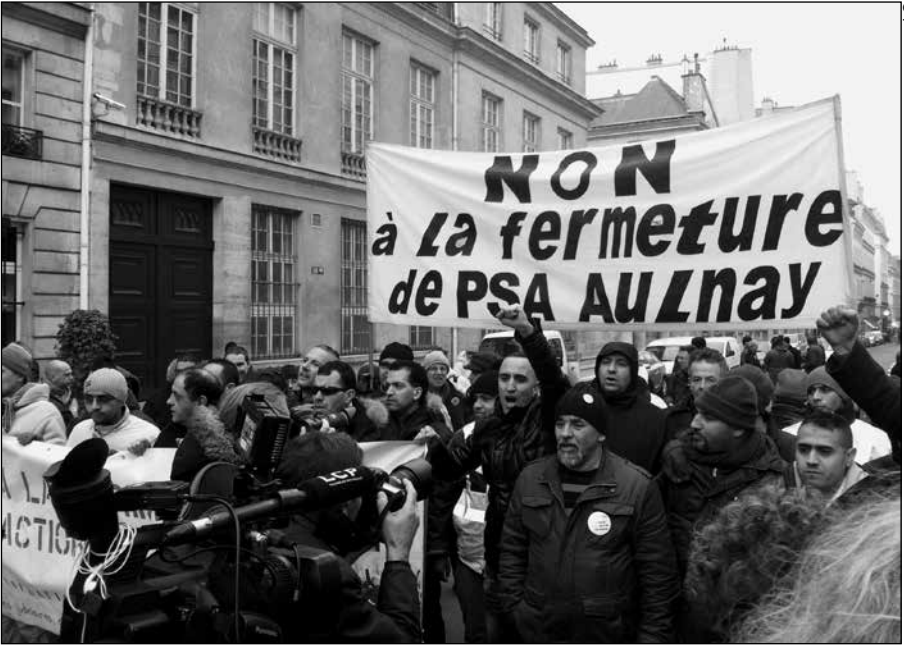
Les travailleurs de PSA Aulnay, alors en lutte contre la fermeture de leur usine.

se soucier de gêner les affaires de la bourgeoisie. La seule perspective pour la classe ouvrière est de se battre pour ses intérêts propres, qui correspondent aux intérêts de la majorité de la société. Cela nécessite de s'en prendre aux intérêts de la classe capitaliste.