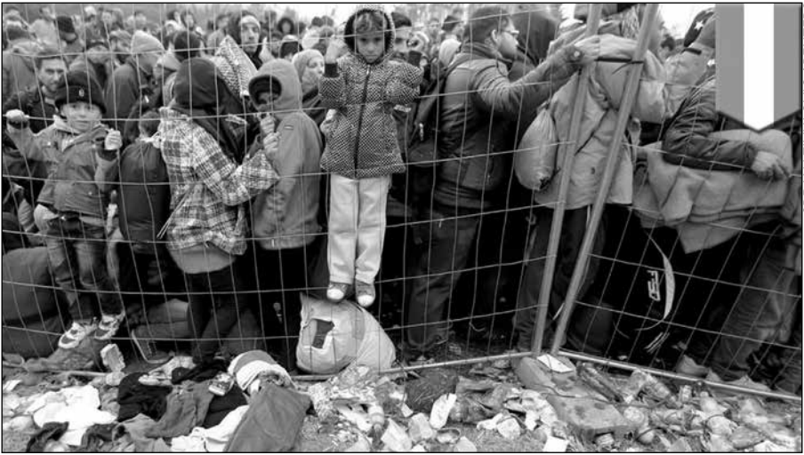
Les migrants se pressent aux portes de l'Europe, qui se ferment pour eux (ici, à la frontière entre la Slovénie et l'Autriche, octobre 2015).

manifeste dans les conditions de cette fuite: il faut risquer la noyade en mer, affronter la brutalité policière des pays traversés, les barbelés, pour passer d'un pays à l'autre. Elle s'affirme par ces camps infâmes où l'on enferme femmes, hommes, enfants par dizaines de milliers, comme s'ils étaient des criminels.