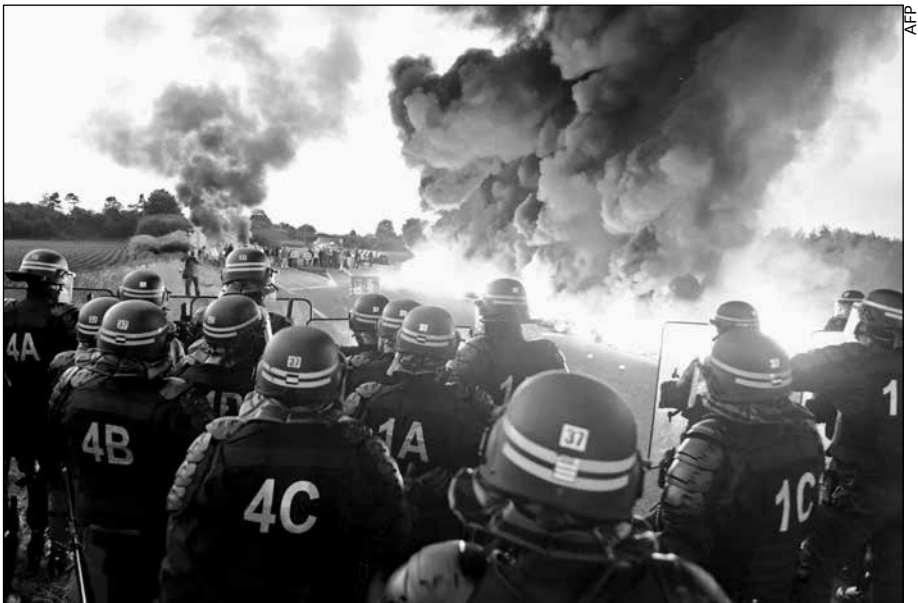
Les CRS débloquent le dépôt de carburant de Douchy-les-Mines (Nord), le 25 mai.

Oui, lorsque les salariés arrêtent de travailler, toute la vie sociale s'arrête.