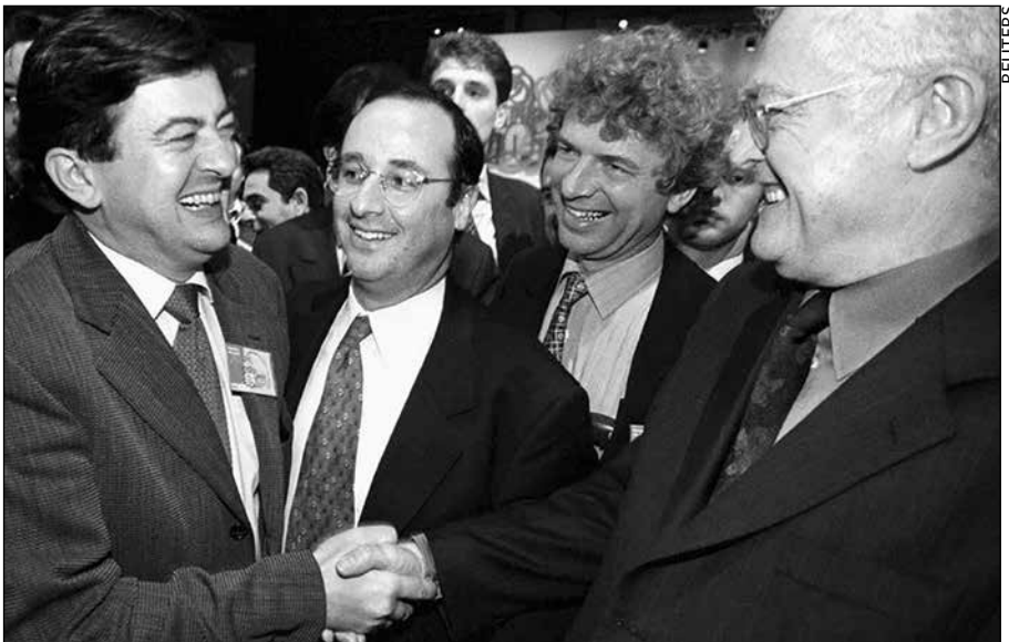
Au PS pendant 30 ans, Mélenchon fut ministre de Jospin, alors que Hollande était premier secrétaire du parti.

La société capitaliste, surtout en cette période de crise, ne laisse pas de voie