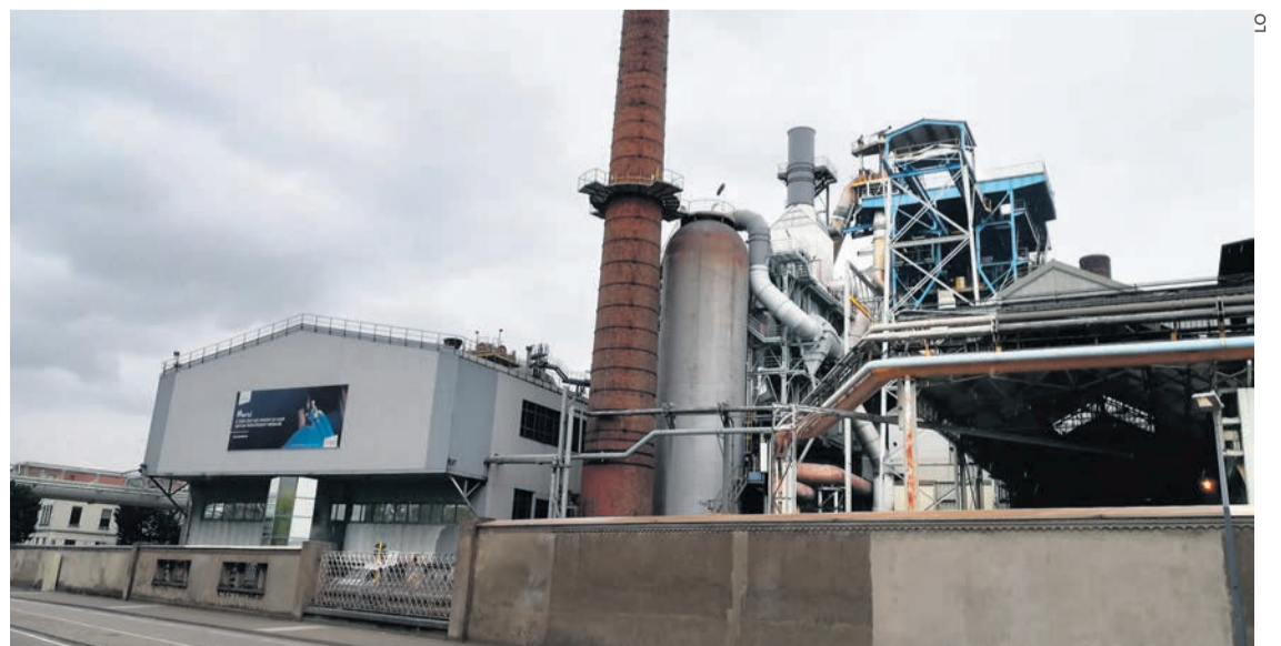
Les derniers hauts-fourneaux en activité en Lorraine.