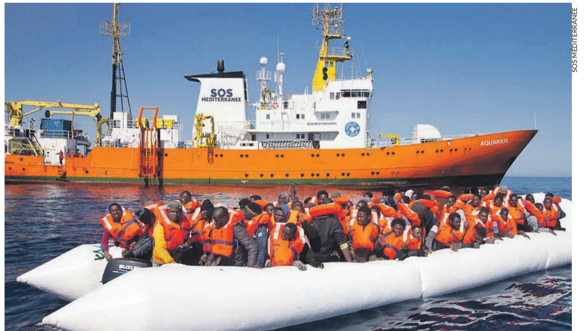
Sauvetage de migrants par l'Aquarius, quand il était encore opérationnel en Méditerranée.