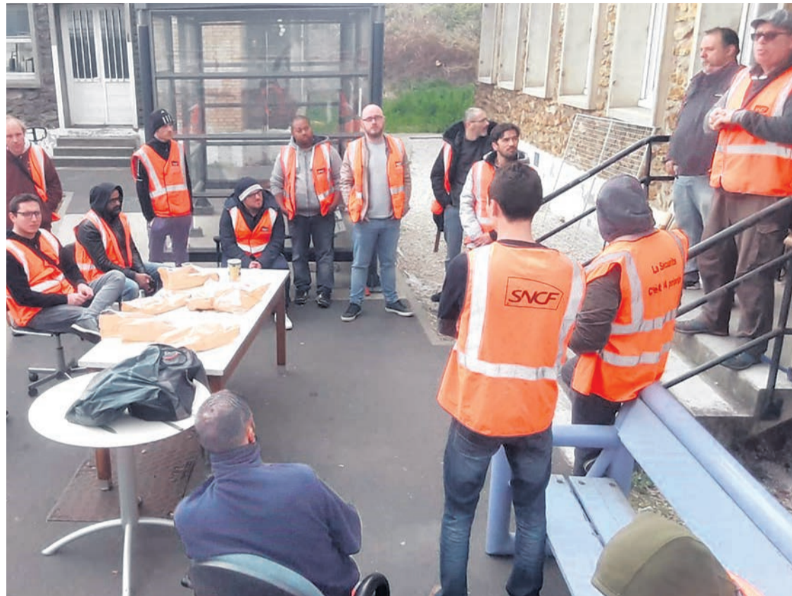
La pause des grévistes de Villeneuve.