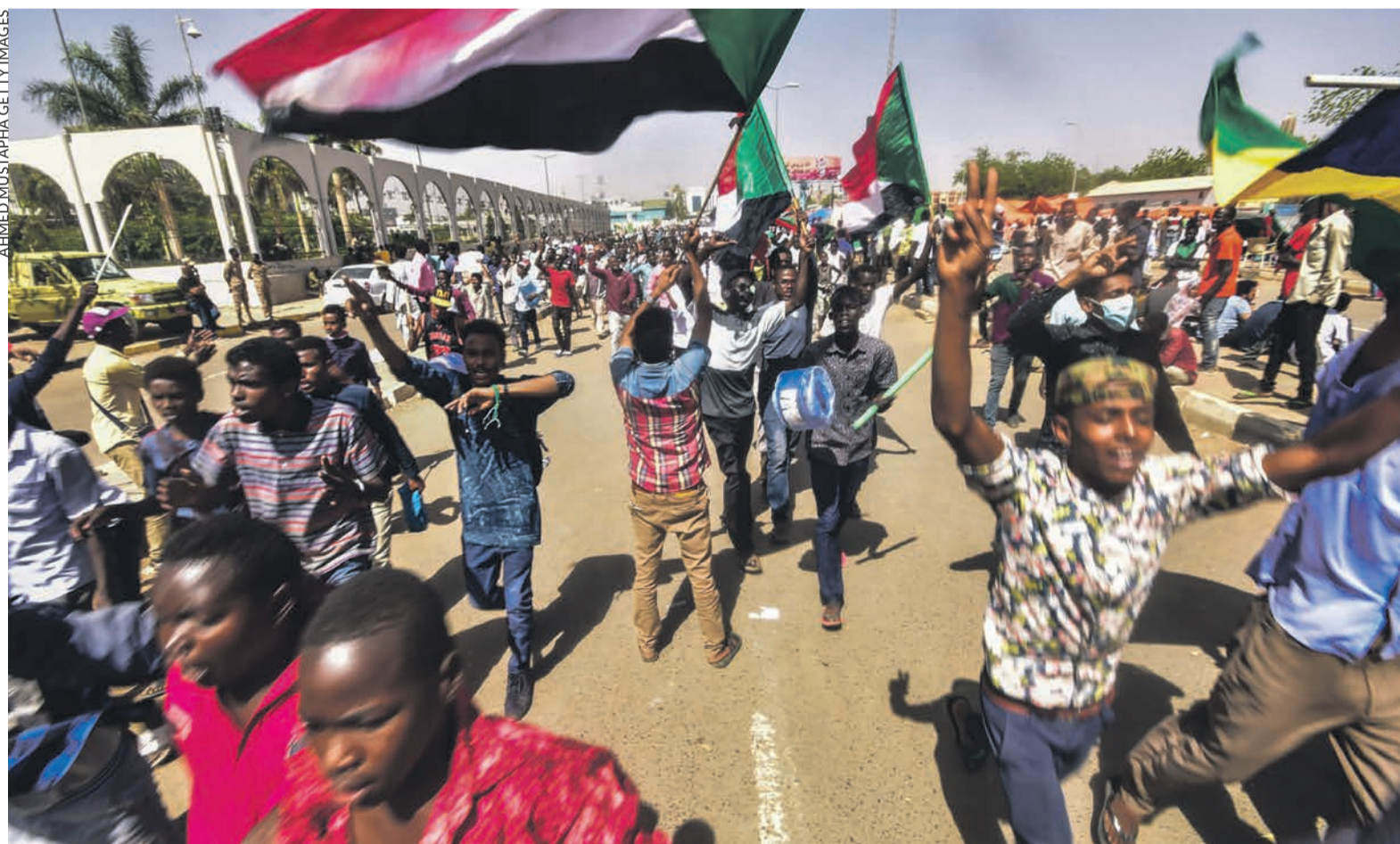
AHMED MUSTAPHA GETTY IMAGES