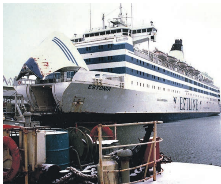
L' Estonia avant son naufrage, poupe relevée.

La Suède, la Finlande et l'Estonie nommèrent une commission d'enquête. Elle ferma le dossier en 1995, déclarant que le naufrage était dû à une fortune de mer imprévisible dont nul ne