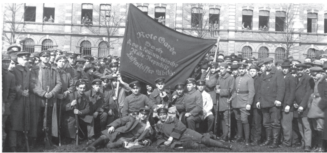
La garde rouge à Munich, avril 1919.

En janvier 1919, les ouvriers de Berlin s'étaient lancés dans une