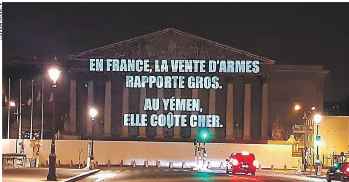
Des ONG ont projeté leur protestation sur l'Assemblée nationale.